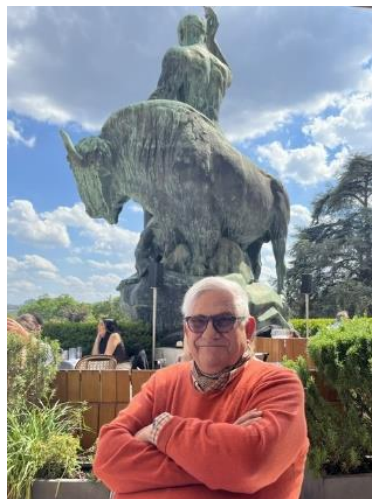
Au café des droits de l'homme devant Hercule terrassant le Bison,